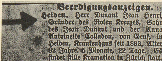
Die Beerdigungsanzeige in der Appenzeller Zeitung.

auf dem Friedhof Sihlfeld ohne jegliches Zeremoniell beigesetzt. Zum Zeichen des Dankes an ihn, der die Nächstenliebe in die Tat umgesetzt hatte, schmückt heute ein Denkmal seine letzte Ruhestätte.