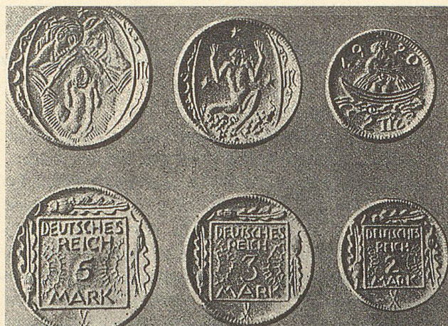
Deutsches Porzellangeld, wie es anstelle von Silbermünzen im Jahre 1920 hergestellt wurde.

Gutes durch schlechtes Geld zu ersetzen hat schon in der Frühzeit des Münzwesens und durch alle Jahrhunderte hindurch dazu gedient, einzelnen Herrschern oder ganzen Staatsgebieten aus finanziellen Schwierigkeiten zu helfen. Auf eine wohl einmalig schlaue Weise ist das mit der spanischen Vellonmünze gelungen, die noch Philipp III. zur Ausgabe brachte. Als der Staat Geld brauchte, zog man diese Münze ein