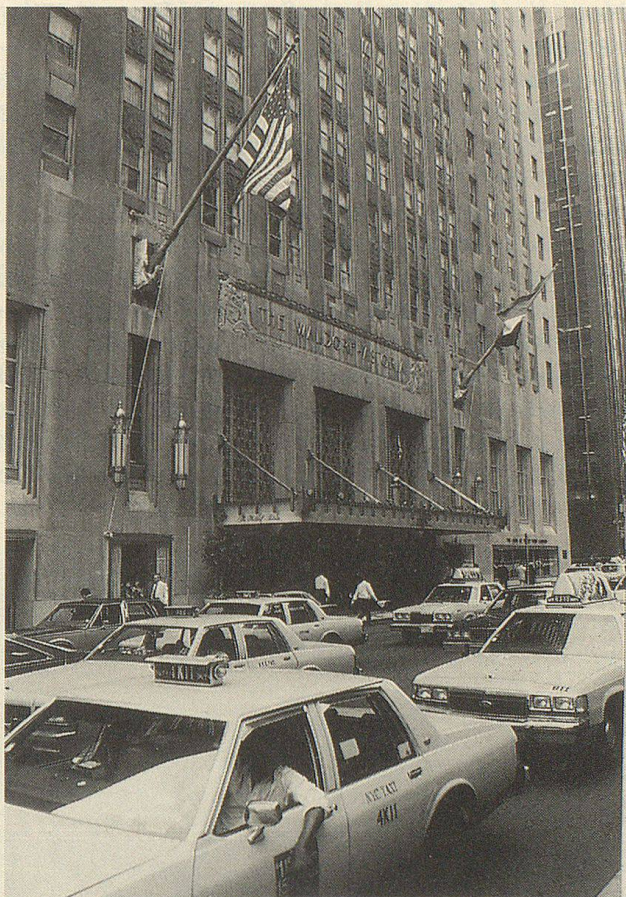
Das «Waldorf-Astoria»-Hotel ist eine New Yorker Institution im Art-Deco-Stil.

1912 gehörte John Jacob Astor zu den Opfern der «Titanic»-Katastrophe, 1919 verbot die Prohibition den Alkoholausschank, prompt rutschten «Waldorf» und «Astoria» in die roten