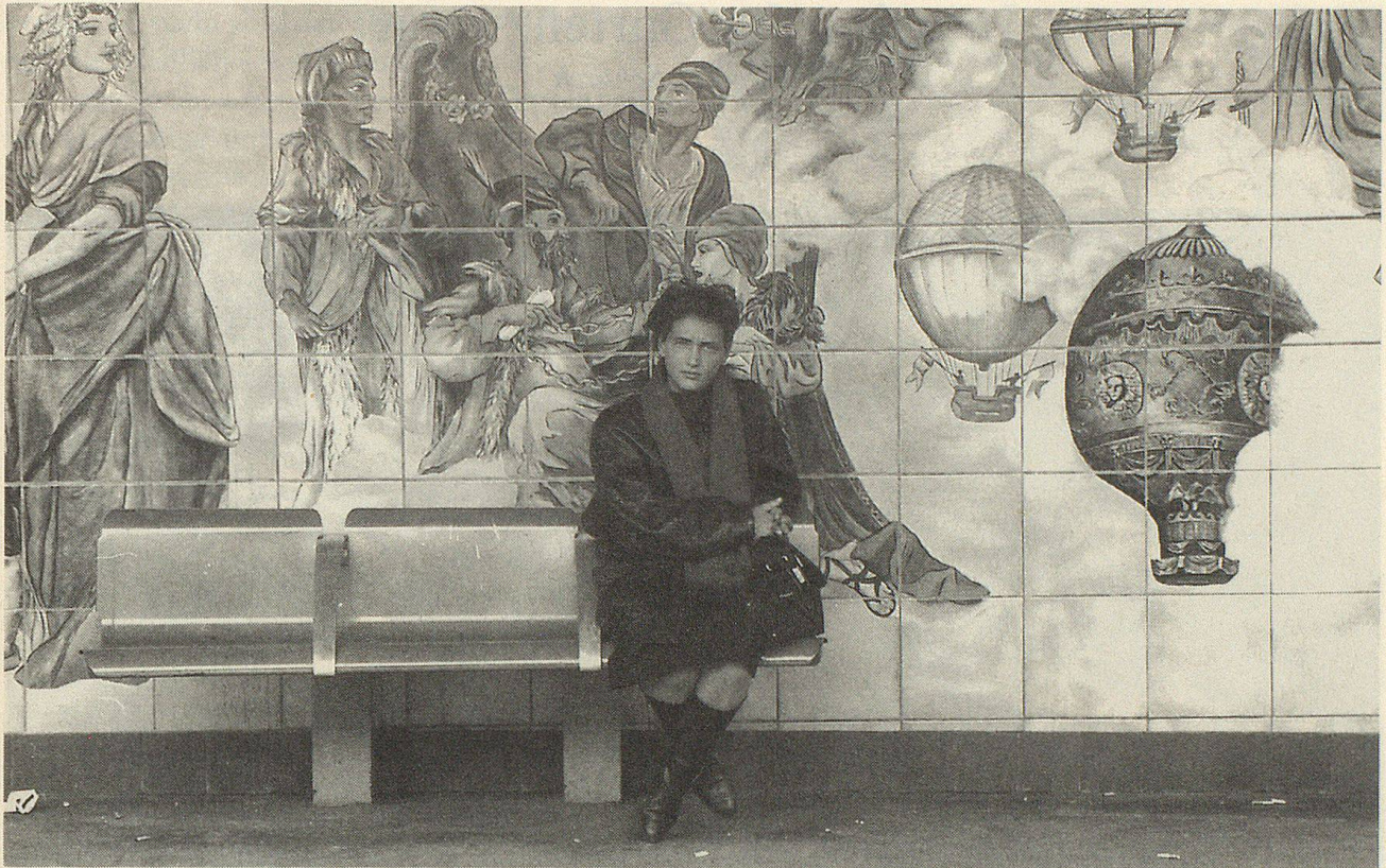
In der Station Bastille erinnern grossflächige Bilder an Szenen aus der französischen Geschichte.

Jean-Paul Belmondo hetzte über die Dächer eines Métro-Zuges, Luc Bessons «Subway» spielte sich fast ausschliesslich unter den Strassen von Paris ab.