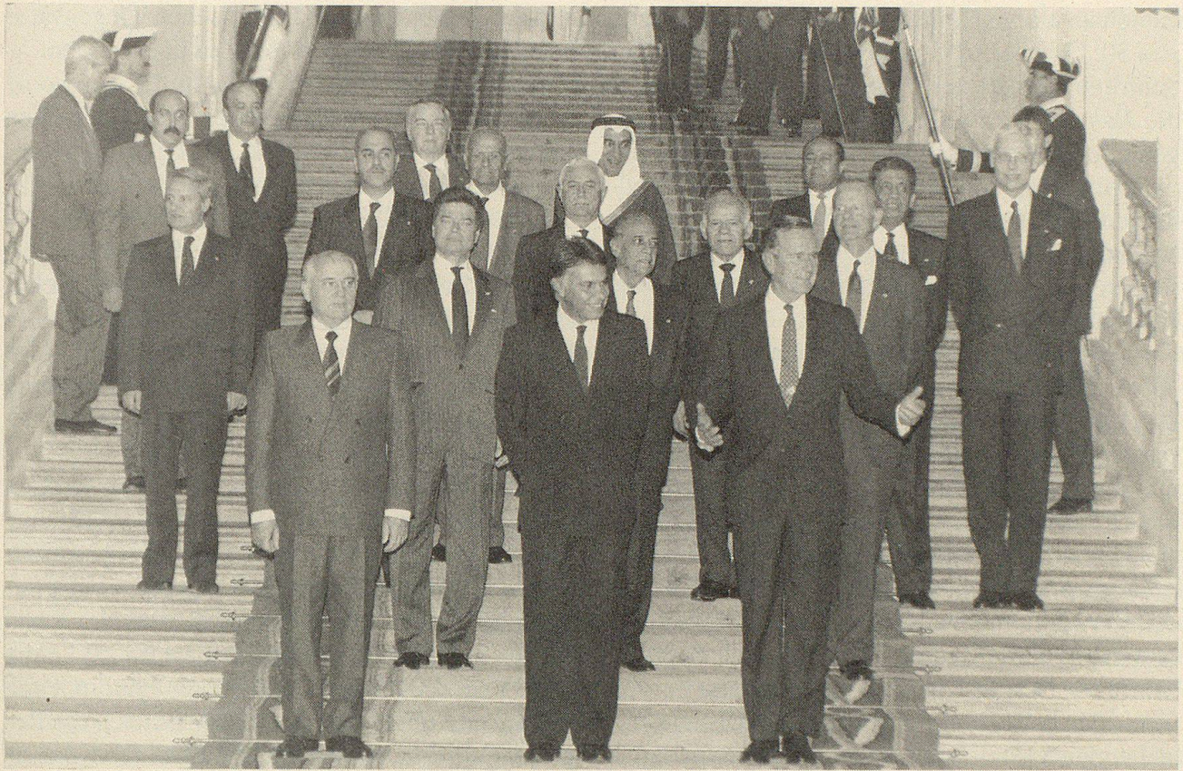
Friedenszeichen in Madrid: Unter der Schirmherrschaft der USA und der Sowjetunion versammelten sich Israel und die arabischen Nachbarstaaten an einen gemeinsamen Tisch.

Entwicklung war zweifellos auch die weit verbreitete Ernüchterung über Schwierigkeiten und Kosten der deutschen Wiedervereinigung. Abnützungerscheinungen der Regierungskoalition in Bonn offenbarte auch der Rücktritt Außenminister Hans-Dietrich Genschers, der das Auswärtige Amt während 18 Jahren geleitet hatte. – Schwere Verluste musste in Italien die regierende Viererkoalition hinnehmen. Christlichdemokraten, Sozialisten, Sozialdemokraten und Liberale kamen bei den Parlamentswahlen vom 5./6. April nur noch auf 48 Prozent (1987: 53,7 Prozent). Als eindeutige Siegerin ging die Lega Nord hervor, die mit ihrem Eintreten für regionale Autonomie rund 9 Prozent der Stimmen gewinnen konnte. – Im Inselkönigreich Grossbritannien gingen die Uhren wieder einmal anders als auf