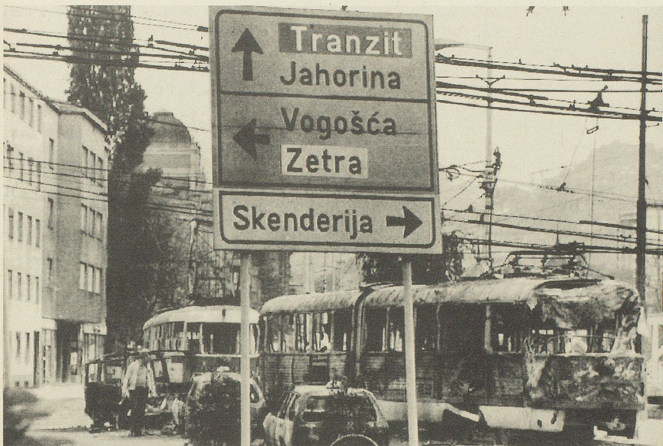
Während der Abfassung dieser Chronik dauerten die Kämpfe in Bosnien unvermindert an.

schen den einzelnen Volksgruppen, zu unterschiedlich die geschichtlichen Voraussetzungen zwischen den einstigen Untertanengebieten des türkisch-osmanischen Reiches, der österreichisch-ungarischen Monarchie und des Königreiches Serbien. Unter der Führung Marschall Titos wurden die nationalen Gegensätze mit eiserner Faust unterdrückt oder verdrängt. Titos Nachfolgern gelang es nicht mehr, das schwierige jugoslawische Erbe beinanderzuhalten. Die Gräben zwischen dem tonangebenden Serbien und den andern Republiken weiteten sich unüberbrückbar aus, als freie Wahlen in Slowenien, Kroatien, Mazedonien und Bosnien-Herzegowina nichtkommunistische Politiker an die Macht brachten, während in Serbien und Montenegro weiterhin Kommunisten den Ton angaben. Zum