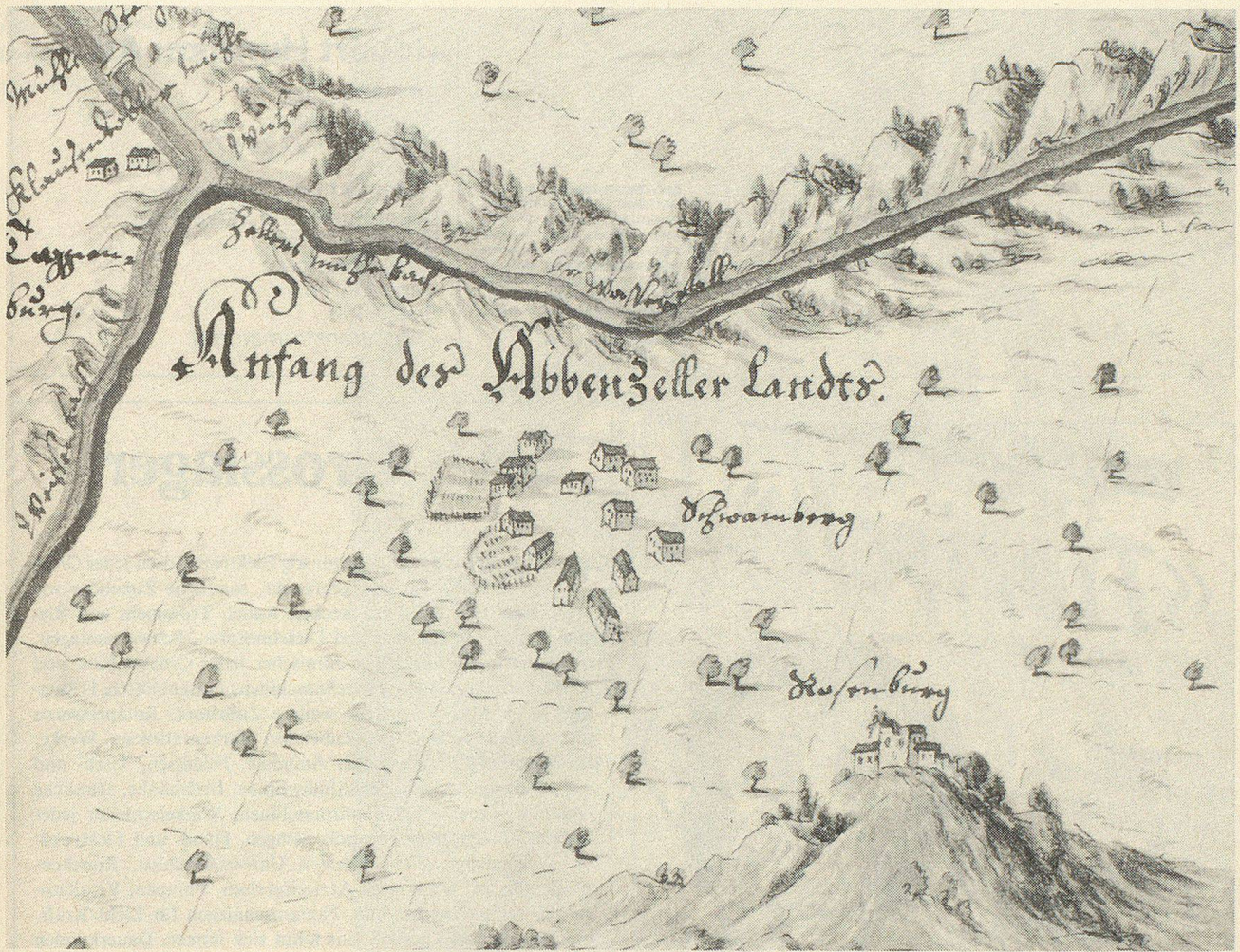
Die Schwänberger Schar nach dem Grenzatlant der Fürstbtei St.Gallen von 1730 (Stiftsarchiv St.Gallen).

Bürgerhaus Nr. 2681 liess etwa die Krypta einer urtümlichen Kirche oder einen geheimen Versammlungsort von Pietisten vermuten.