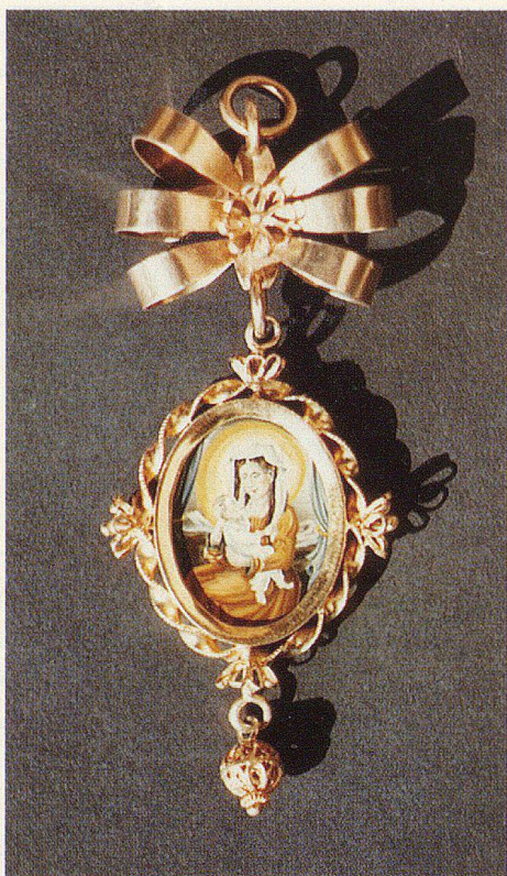
Hinterglasbemalter Filigranschmuck mit religiösen...