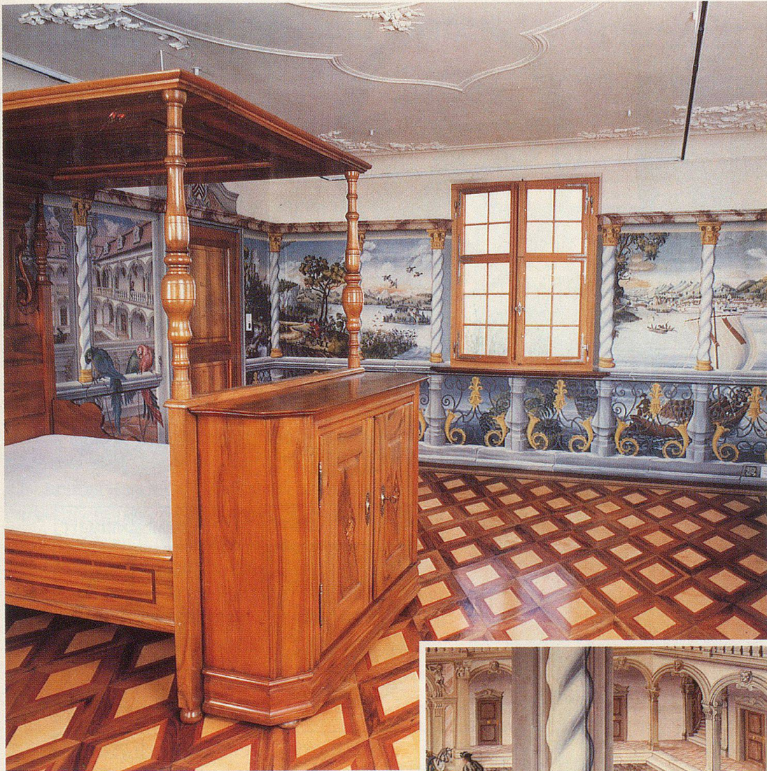
Das illusionistisch-barocke Jagdzimmer eines privaten Liebhabers, welches den Hundwiler Künstler für rund 1 1/2 Jahre absorbierte.