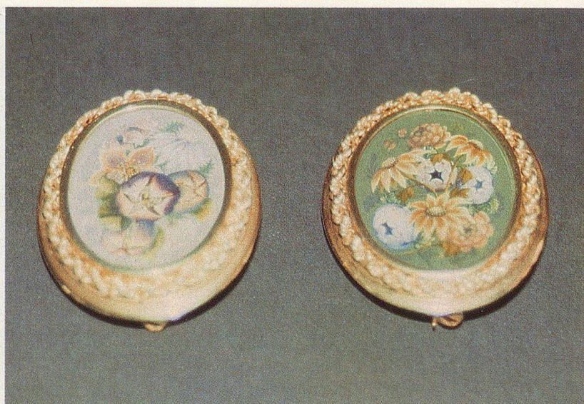
...oder auch mit profaneren Blumensujets.

In Detailreichtum zeichnen sich auch die bemalten Eier aus. Nur bleibt dafür neben den grösseren Aufträgen kaum noch Zeit.