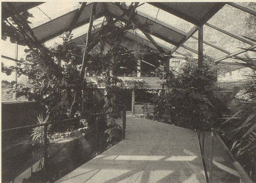
Das Tropenhaus – Alligatoren, Weissbüscheläffchen und Kleinvögel beleben diese kleine Tropenwelt.

gen unter anderem das Tropenhaus, das einen Ausschnitt aus einer Urwaldlandschaft mit ihrer Tierwelt wiedergibt. Auf einer Fläche von 120 m 2 und einer Höhe von 10 m spielt sich hier subtropisches Leben ab. Alligatoren, Weissbüscheläffchen und Kleinvögel beleben diese vom Besucher begehbbare kleine Tropenwelt.