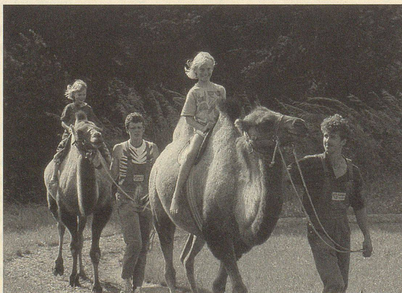
Kamelreiten – eine der Attraktionen im Walter Zoo.

Öffnungszeiten: Der Walter Zoo Gossau und das Zoo-Restaurant sind täglich von 9 bis 18 Uhr geöffnet.