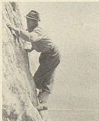
Bergsteiger in den Kreuzbergen