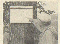
Erster Gesund- heitswanderweg