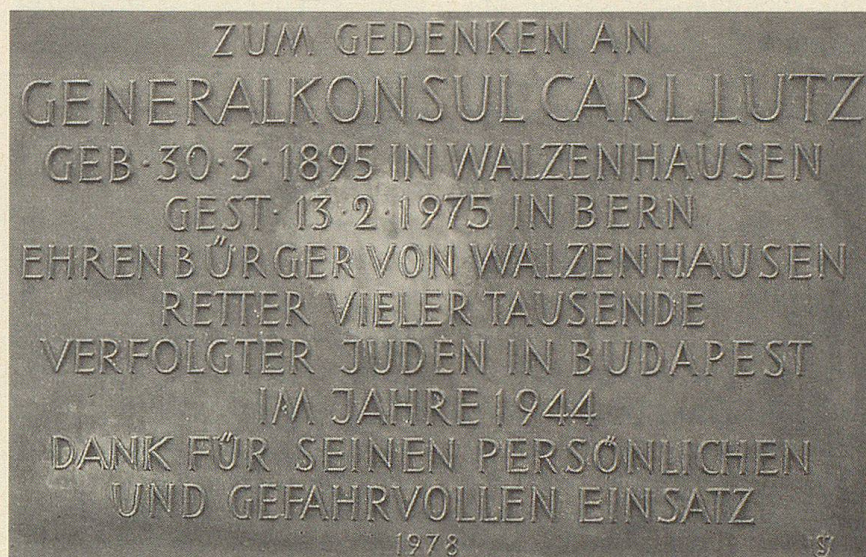
Die Gedenktafel für Carl Lutz an der Kirchenmauer in Walzenhausen

Schweizer Gesandte, verliessen die Hauptstadt. Vizekonsul Lutz und seine Frau, aber auch weitere Angestellte, harrten dennoch auf ihren Posten aus; sie wollten die Menschen, für deren Schutz