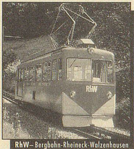
RhW – Bergbahn-Rheineck-Walzenhausen

Von Rorschach-Hafen aus (400 m ü.M.) führt Sie die Rorschach-Heiden-Bergbahn – die einzige Zahnradbahn am Bodensee! – in halbstündiger Fahrt (im Stundenakt)