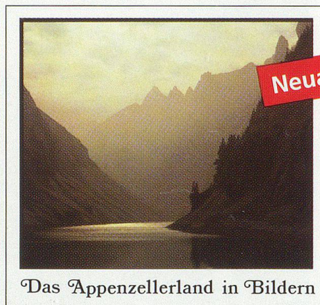
Das Appenzellerland in Bildern

Amelia Magro, Ueli Wilhelm Das Appenzellerland in Bildern