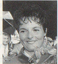
Erste Innerrhoder Regierungsrätin Ruth Metzler