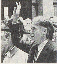
Bundesrat Moritz Leuenberger