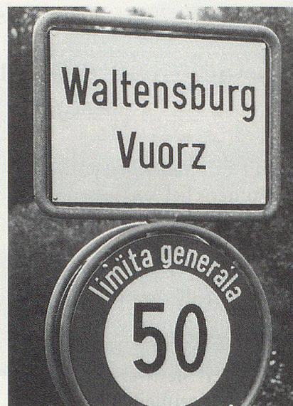
Waltensburg/Vuorz: Die Ortstafel zeigt, dass hier im Bündner Vorder- rheintal Deutschsprachige und Rätoromanen zusammenleben.

Vor allem Gewässer- und Bergnamen, die zu den ältesten Bezeichnungen auf der Landkarte gehören, gehen nicht selten auf keltische Zeiten zurück. Dazu zählen Flüsse wie Aare, Rhein und Rhone; sie enthalten die Wortwurzel «ar» oder «ran/ron», was «rinnen» bedeutet. «Mor» hingegen weist auf eine gebirgige Geländeform hin: Damit bezeichneten unsere fernen Vorfahren eine steinige, felsige, geröllreiche Gegend. Morgetenhorn, Morschach und Morcote retten diesen Keltenklang in die Gegenwart hinüber. Auch das Schlachtfeld am Morgarten an der Grenze von Schwyz zu Zug enthält dieses «mor». Tatsächlich wälzten die Eidgenossen an jenem Novembertag des Jahres 1315 grosse Steinblöcke auf das österreichische Ritterheer herunter. Die volkstümliche Deutung der blutigen Stätte als «Mordgarten» kann schon deshalb nicht zutreffen, da ja Morgarten bereits vor der Schlacht so hiess («hütet euch am Morgarten»).