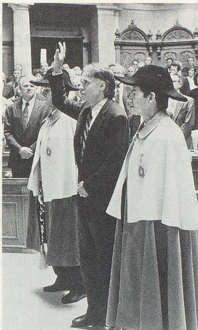
Am 27. September 1995 wurde der Zürcher SP-Regierungsrat Moritz Leuenberger als Nachfolger Stichs in den Bundesrat gewählt; ihm wurde die Leitung des Verkehrs- und Energiewirtschaftsdepartements übertragen.

Einen Lichtblick stellte die 10. AHV-Revision dar, welche vom Schweizervolk am 25. Juni mit einem Ja-Stimmen-Anteil von 60,7 Prozent angenommen wurde; wegen der schrittweisen Erhöhung des Frauen-Rentenalters von 62 auf 64 Jahre hatten die Gewerkschaften das Referendum ergriffen. Auch gegen die Revision des Arbeitsgesetzes, das den flexibleren Einsatz von Arbeitskräften ermöglicht und damit zur Erhaltung von Arbeitsplätzen beitragen kann, kam von Gewerkschaftsseite das Referendum zustande. Wie gespannt das sozialpolitische Klima geworden war, offenbarten die geharnischten Reaktionen auf die Publikation «Mut zum Aufbruch», in der