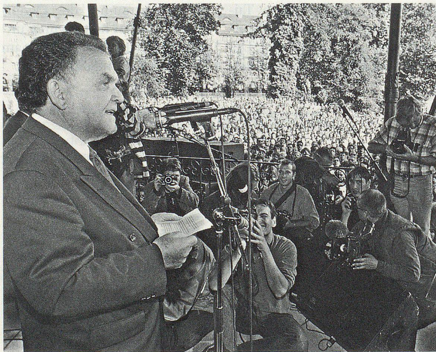
SP-Bundesrat Otto Stich trug wesentlich zum Erfolg der SP bei den Nationalratswahlen bei mit seiner Rücktrittsankündigung wenige Wochen vor dem Urnengang wie auch mit seinem Auftritt anlässlich der Anti-Blocher-Kundgebung vom 23. September in Zürich.

des Bundeshaushalts: Der Finanzplan für die Jahre bis 1999 sieht immer noch Wachstumsraten von 2 Prozent und jährliche Defizite von über drei Milliarden vor. Ob der Budgetausgleich bis zum Jahr 2001 gelingt, wie ihn der Bundesrat ins Auge fasst, hängt nicht zuletzt von der Neu-regelung des Finanzausgleichs ab: Gemäss dem vom Finanzde-partement und den kantonalen Finanzdirektoren entwickelten Konzept sollen insgesamt 29 Bereiche – unter ihnen das Militär – entflochten werden. Ausgemacht wurde ein Sparpotential von 2 bis 3 Milliarden; ob die entsprechenden Opfer von der Bevölkerung hingenommen werden, ist indessen keinesfalls sicher. Eine