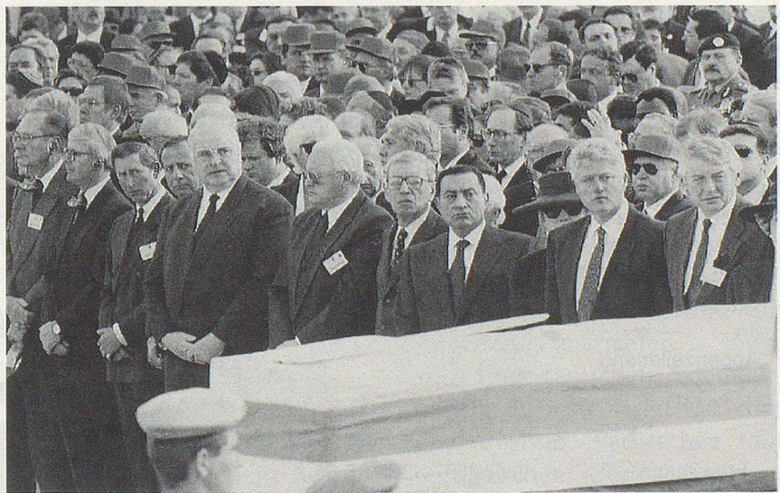
Staats- und Regierungschefs aus aller Welt, unter ihnen US-Präsident Clinton, König Hussein von Jordanien und der ägyptische Präsident Mubarak, gaben am 6. November dem ermordeten israelischen Premierminister Yitzhak Rabin in Jerusalem das letzte Geleit.

Selten waren Hoffnung und Entsetzen einander wohl so nahe wie bei der Ermordung des israelischen Regierungschefs Yitzhak Rabin am 4. November 1995 in Tel Aviv. Rabin hatte an einer Grosskundgebung für den Frieden vor rund hunderttausend Menschen gesprochen. Auf dem Rückweg zu seinem Auto war er einen Moment lang nicht ausreichend geschützt. Aus nächster