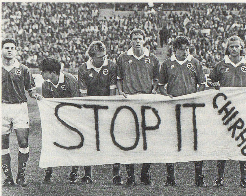
Die französischen Atomwaffentests im Südpazifik lösten weltweit Proteste aus; daran beteiligte sich auch die schweizerische Fussball-Nationalmannschaft (am 6. September anlässlich eines Länderspiels in Göteborg).

Ungeachtet des Tschetschenien-Krieges blieben Europas Türen für Russland offen: Der Europarat beschloss, die Russische Föderation als 39. Mitgliedsstaat aufzunehmen. Er ging damit ein grosses Risiko ein, konnte doch Russland zu diesem Zeitpunkt keinesfalls als gefestigte Demokratie betrachtet werden; auch die Hoffnung, den Koloss im Osten politisch einbinden und auf demokratisch-rechtsstaatliche Werte verpflichten zu können, ruhte auf schwachen Füßen. Dass Russland ein schwer berechenbarer Faktor der Weltpolitik ist, zeigten die Parlamentswahlen vom 17. Dezember. Mit fast 22 Prozent der Listenstimmen errangen die Kommunisten die meisten Stimmen; sie gewannen 157 (bisher 45) der insgesamt 450 Sitze in der Staatsduma. An die zweite Stelle rückten mit rund 11 Prozent die Liberaldemokraten des Rechtsextremisten Schirinowski, gefolgt von «Unser Haus Russland» von Ministerpräsident Tschernomyrdin mit rund 10 Prozent und dem Reformblock «Jabloko» des Demokraten Jawlinski. In dieses Bild der Instabilität und Unberechenbarkeit fügten sich auch die Meldungen über den Gesundheitszustand des Präsidenten