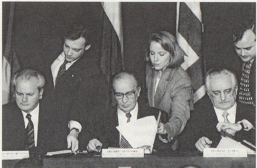
Die Präsidenten Serbiens, Bosniens und Kroatiens, (von links) Milosevic, Izetbegovic und Tudjman, paraphieren am 21. November auf der US-Luftwaffenbasis Dayton das Friedensabkommen für Bosnien.

Trotz dieses Krieges gelang es Premierminister Schimon Peres und seiner Arbeiterpartei nicht, die Wahlen vom 29. Mai zu ihren Gunsten zu entscheiden. Viele Israelis zweifelten offenbar an der Fähigkeit von Rabins Nachfolger, mit dem Friedensprozess die Sicherheit des jüdischen