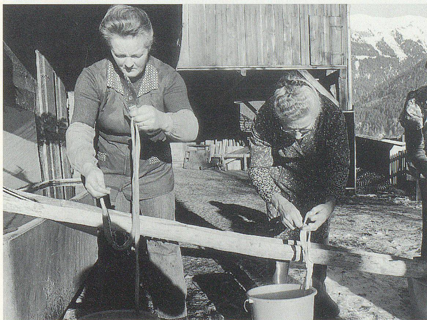
Die Frauen reinigen die Därme.

Mit Argusaugen blicken die Metzger auf die Schlachttätigkeit der Bauern. Die Metzger, scharfen staatlichen Vorschriften unterworfen, argwöhnen, dass die Landwirte mit andern Spiessen kämpfen. Von einer Hausmetzger darf zwar von Gesetzes wegen kein Fleisch an Dritte verkauft werden. Wo Landwirte aber in bewilligten Räumen schlachten und das Fleisch selber zubereiten und direkt vermarkten, können sie zur Konkurrenz der Metzger werden. Vom Ausschalten des Zwischenhandels erhoffen sich die Landwirte die Aufbesserung ihres zum Teil arg geschrumpften Einkommens. Das Fleisch von der Hausmetzger im alten Stil müssen die Bauern jedoch selbst essen. Und darum ist dieser alte Brauch unter dem Titel «Selbstversorgung» zu sehen, manche nennen ihn schlicht «Folklore».