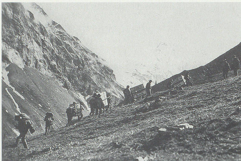
Erste Steinwild-Aussetzung in den Grauen Hörnern (1911).