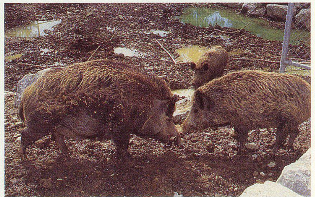
Ihnen ist es sauwohl im Wildpark auf Rotmonten: Wildsau und Keiler.