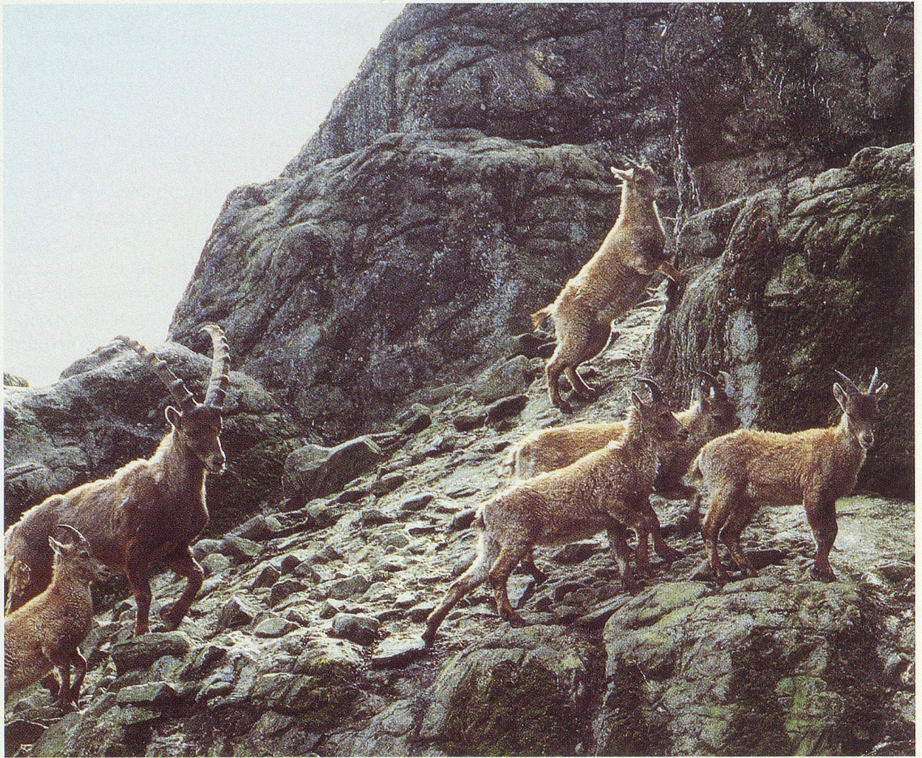
Steinbockgruppe auf den künstlichen Felsen.