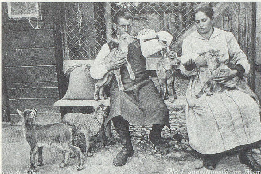
Die Flasche muss helfen, aus den Kitzen echte Böcke und Geissen zu machen.

zweiten Jahr zogen weitere Tierarten in den Wildpark ein: Rehe, Gemen, Mufflons, Hasen, Sika- und Axishirsche. Diese letzten waren ein Geschenk des Königs von Württemberg, der laut Chroniken von der neuen Anlage hell begeistert war.