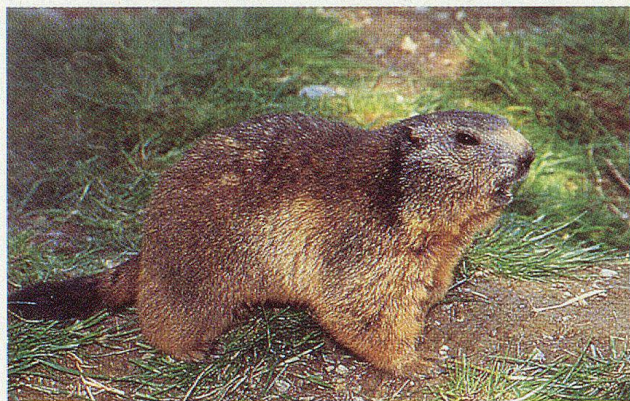
Mit etwas Ruhe und Geduld wird man sie zu sehen bekommen: Murmeltier im Park.