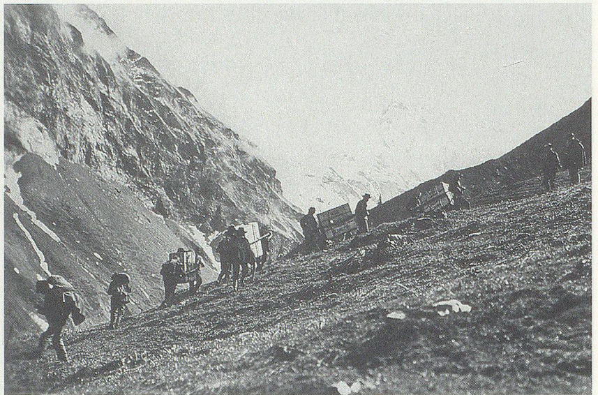
Erste Steinwild-Aussetzung in den Grauen Hörnern (1911).

«Als es hiess, der Scheitlinsche Hirscheinfang an der Jägerstrasse müsse eingehen, nahm ich mir vor, im stillen eine passende Fläche zu suchen, um einen Wildpark zu gründen. Ich prüfte zuerst die Totenweihergegend, dann die Bernegg. Als schönstes Areal punkto Aussicht, Lage, Wechsel von Wiese und Wald, Tobel und Ebene präsentierte sich die Fläche des jetzigen Wildparks Peter und Paul. Aber dieselbe war Privateigentum des