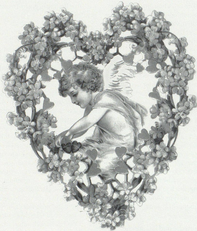
Das Vergissmeinnicht-Herz mit Amor und den Glückskleebündel.

einer Person, durch die sie enttäuscht worden war, wehen Herzens entfernt? – Lassen wir es auf sich bewenden.