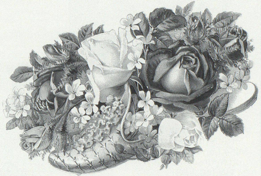
Der hellblaue Satin-Pantoffel mit Blumen gefüllt.

Ausgehend von diesen Bil- dungsstätten feierten im letzten Jahrhundert die Poesie-Alben einen wahren Siegeszug durch Europa. Im Laufe der Jahrzehn- te wurde aber das Führen eines Albums immer mehr eine reine Mädchensache. Freundinnen und Verwandte erfreuten die Al- bum-Besitzerinnen mit gefühl- vollen Versen. Selten durfte ein Bub sich im Album seiner Schwester verewigen, denn die Töchter waren mehr erpicht auf Einträge von Lehrerinnen, Leh- rern und – welch erstrebenswer-