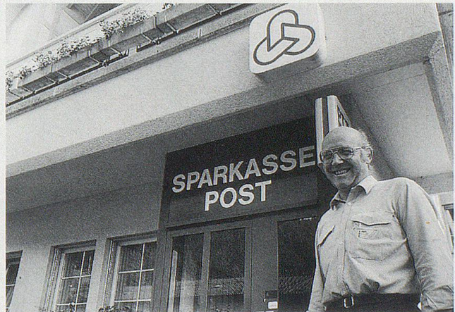
Die Gemeindesparkasse Reute feierte 1994 das 160jährige Bestehen. Heute führt die Sparkasse Wolfhalden-Reute Zweigstellen in Reute, Schachen, Wolfhalden und Lutzenberg.

Nachschlüssel Autoschlüssel Schliessanlagen Kassetten und Tresore Schilder gravieren