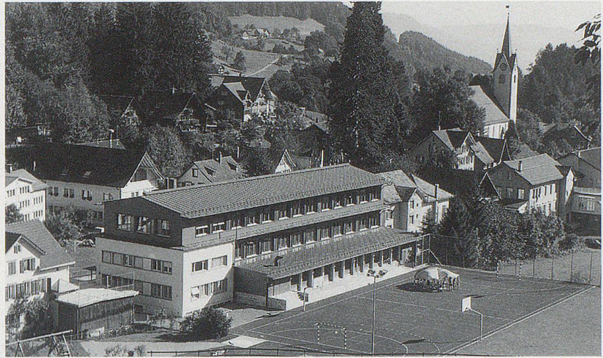
Das 1994/95 erweiterte Schulhaus im Dorf gehört heute zu den Wahrzeichen von Reute.