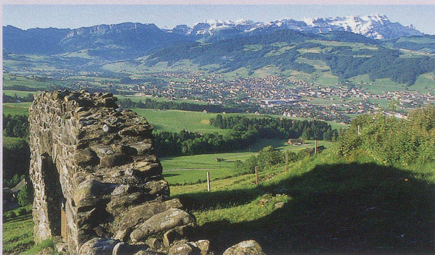
Blick von der Bergruine Clanx aus auf Appenzell und Säntis.