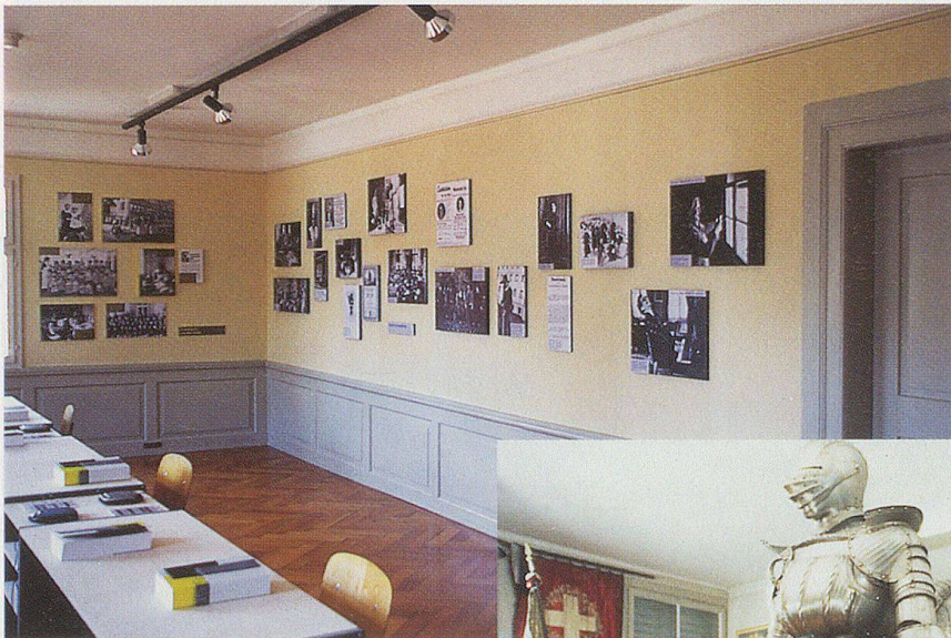
Der ehemalige Lehrsaal (oben) dient seit 1999 für Wechselausstellungen.