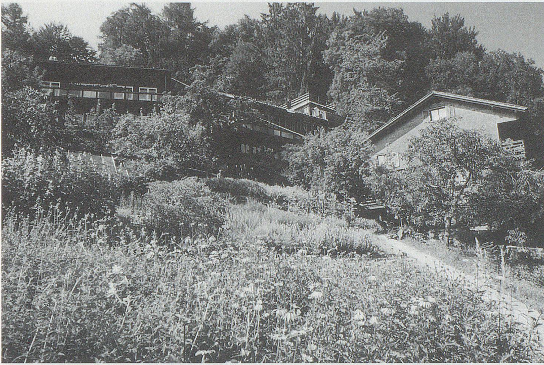
Das A.-Vogel-Gesundheitszentrum in Teufen mit Museum und Heilkräuter-Schaugarten – ideal für einen Ausflug.

1952 wurden mehr als zwei Millionen Exemplare verkauft. Auf über 860 Seiten enthält dieses Standardwerk eine Fülle von Ratschlägen für eine Gesundheit im Einklang mit den Gesetzen der Natur. «Der kleine Doktor» bildete den Höhepunkt des publizistischen Schaffens des bei Erscheinen 50 Jahre alten Autors.