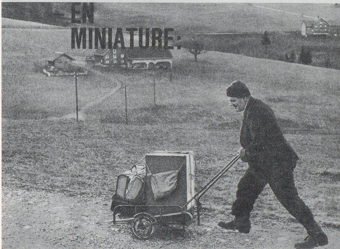
Noldi Heierle unterwegs mit seinen Kurzwarenartikeln auf dem Buchberg bei Hundwil.