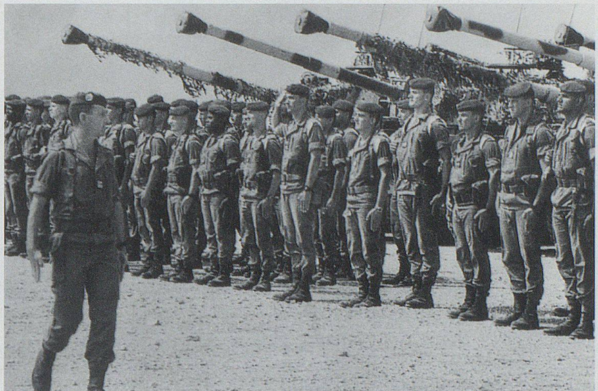
Im Rahmen von UNO- und Nato-Mandaten stehen heute Einheiten der Fremdenlegion unter anderem in Ex-Jugoslawien im Einsatz.

Kommt der sprichwörtliche Traditionalismus der Franzosen