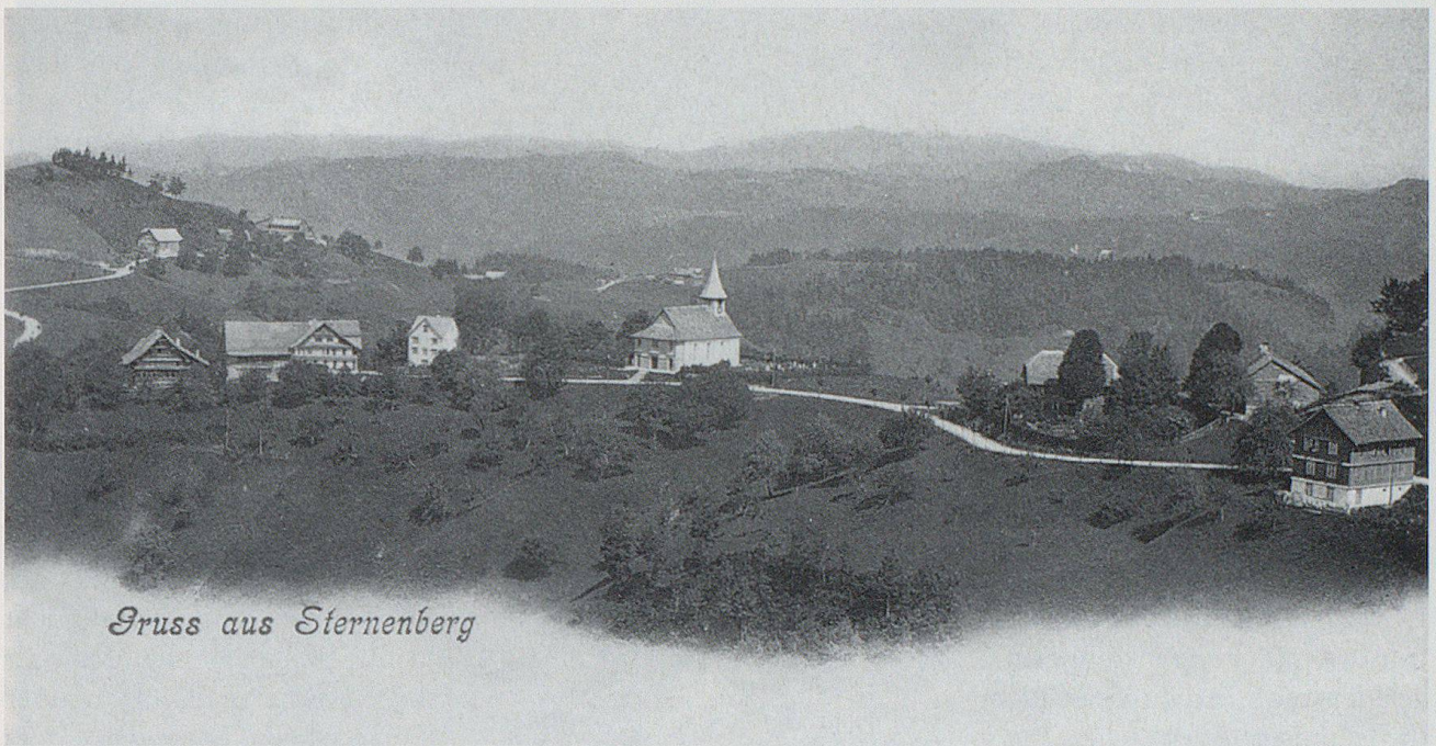
Gruss aus Sternenberg

Aus dem Appenzellerland zog Jakob Stutz 1841 zu einer verwitweten Schwester nach Sternenberg im Zürcher Oberland, wo er einen Kreis junger Dichter um sich scharte.