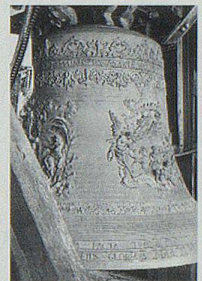
«Grosse Glocke», Herisau