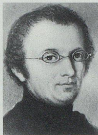
Pater Alberich Zwyszig