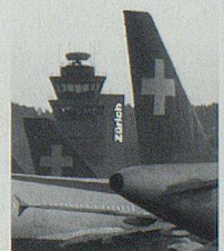
Untergang der Swissair