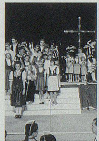
Kantonaltage an der Expo