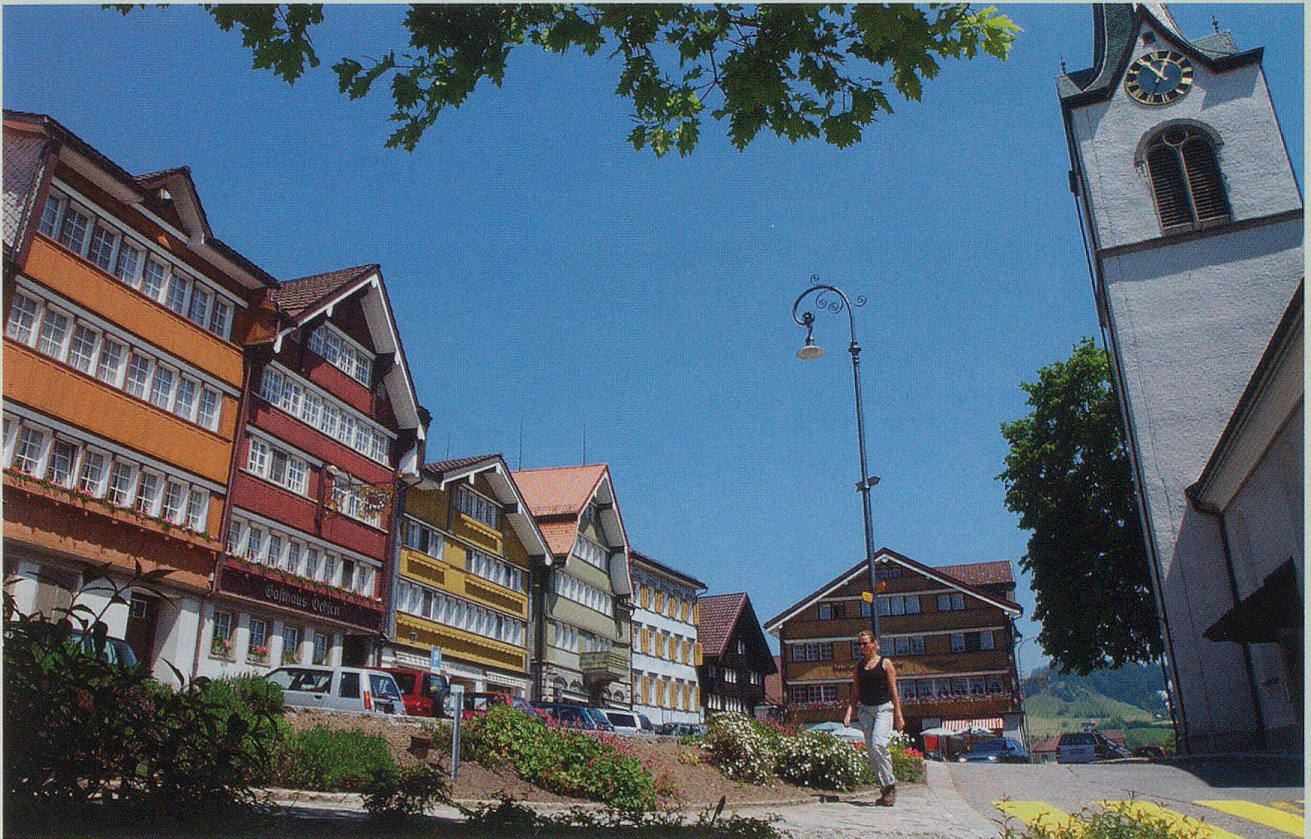
Der Dorfplatz Urnäsch – einer der schönsten und malerischsten weitherum.

TEXT: ESTHER FERRARI · FOTOS: HANS ULRICH GANTENBEIN