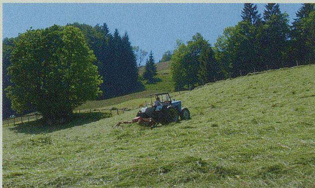
Die Landwirtschaft – noch heute ein wichtiger Erwerbszweig.

Vor zwanzig Jahren gab es weit mehr Bauernbetriebe, heute sind es nur noch 97. Umzonung, intensivere Bodenbearbeitung, Güterzusammenlegung, Maschinen, die rationell arbeiten, haben dazu geführt, dass Bauernbetriebe zu kleinen Industriebetrieben geworden sind. Einige Bauernfamilien versuchen mit Eigenprodukten zu werben. Zudem wird in einigen Verkaufsläden im Dorf Käse aus Alpbetrieben angeboten. Eier gibt es aus dem Dorf zu kaufen. Metzgereien geben die Namen der Bauern bekannt, aus deren Stall das Tier stammt, dessen Fleisch sie verkaufen.