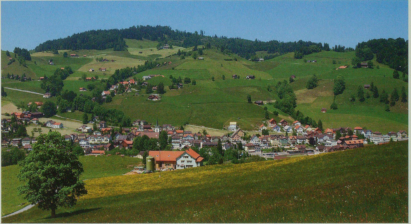
Blick von Süden auf die Gemeinde Urnäsch.

Gossau Anschluss auf den Inter-city, in Herisau an die Südostbahn Romanshorn–Luzern. Die Autobahn ist via Herisau–Gossau oder Winkeln zu erreichen und das Rheintal am schnellsten über den Eichberg durch die Nachbardörfer Gonten und die Umfahrung Appenzell. Eine Strasse führt über Zürchersmühle nach Hundwil, eine über die Schönau nach Bächli–Hemberg, die andere über den Tüfenberg nach Schönengrund.