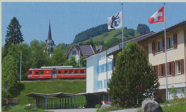
«Mittel» – das Militärhotel beim Bahnhof.

Von den Erwerbstätigen arbeiten in Industrie und Gewerbe 41%, im Dienstleistungssektor 49,3% und 9,7% in der Landwirtschaft.