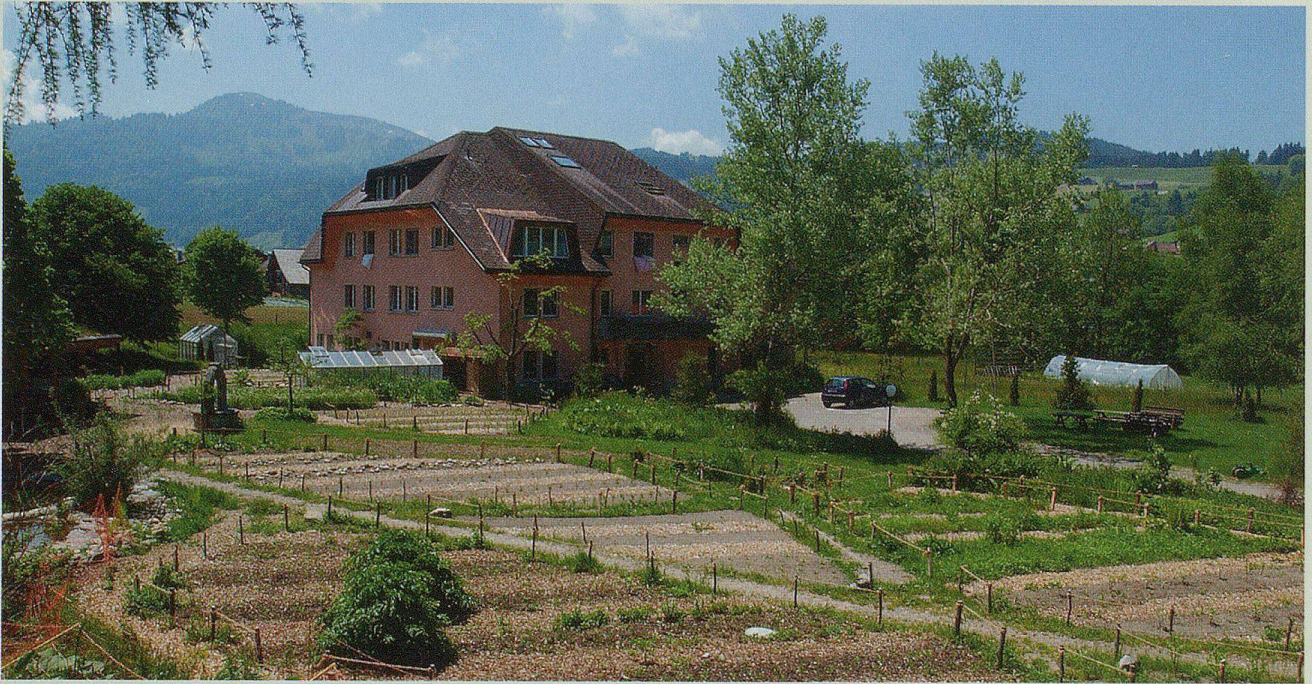
Das «Columban», 1961 auf dem ehemaligen Areal des Waisenhauses gegründet. Ein Heim für schwerstbehinderte Kinder.