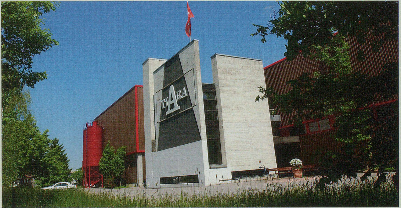
Die Tiara Teppichboden AG, gegründet 1965, ist ein wichtiger Arbeitgeber.

museum vermittelt ein umfassendes Bild von gelebten Traditionen und verschiedenen Bräuchen, welches Silvesterkläuse, das Urnäser Männerbloch, Appenzeller Streichmusik, Bauernmalerei und Sennenkultur, Schelleschötte und Talerschwingen umfasst.