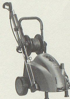
Profi Hochdruckreiniger für Kalt- und Warmwasserbetrieb