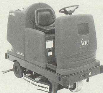
Scheuersaugmaschinen für kleine bis grosse Reinigungsflächen