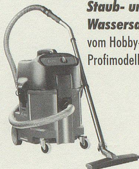
Staub- und Wassersauger vom Hobby- bis zum Profimodell