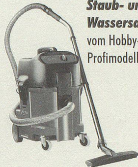
Staub- und Wassersauger vom Hobby- bis zum Profimodell