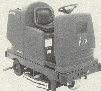
Scheuersaugmaschinen für kleine bis grosse Reinigungsflächen