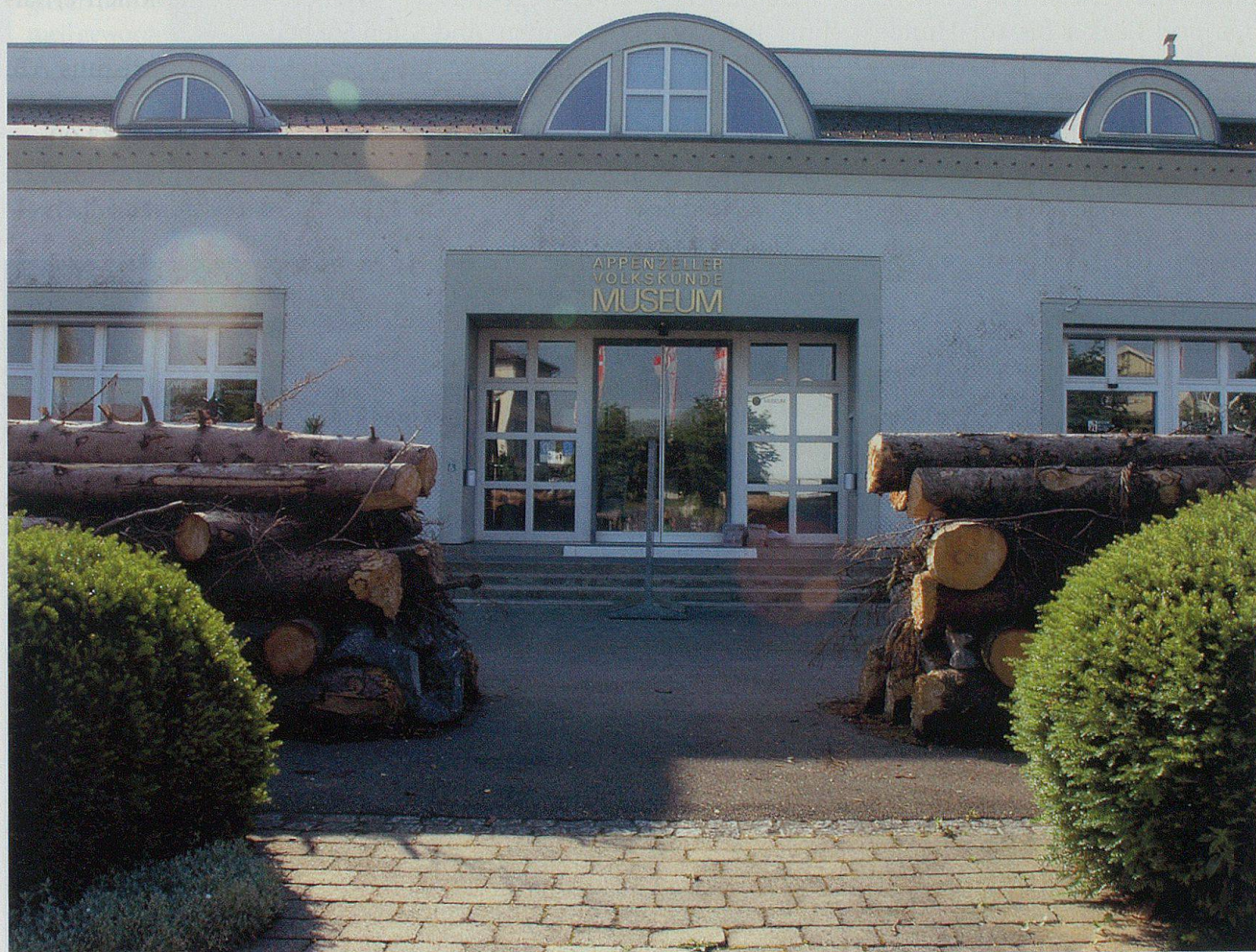
Des Volkskundemuseum Stein mit der vor dem Eingang errichteten Letzi – im Zusammenhang mit der Sonderausstellung «600 Jahre Schlacht am Stoss»

Ein erstes grosses Ziel der Leute aus der Unteren Rhode war erreicht.