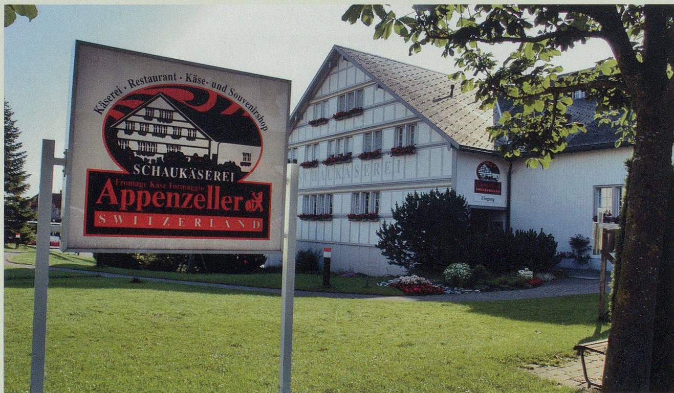
Die Schaukäserei – eine Touristenattraktion.