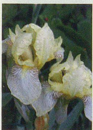
Kulturgeschichte der Schwertlilie