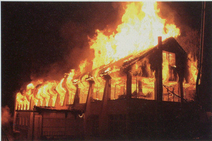
Am 31. Oktober wurde die Liegenschaft der Zwirnerei Bäumlin in Lutzenberg ein Raub der Flammen.

50 Kilometer lange «Route 22» durchmisst das Hügelland von Appenzell Ausserrhoden. Vielfältig wie die Naturlandschaft sind auch die kulturellen Zeugen entlang der «Kulturspur». 420 gelbe Wanderwegweiser mit dem Symbol «22» sowie 75 braune Hinweistafeln erschliessen die 50 Kulturobjekte entlang der sich über die «Tobel und Höger» von Appenzell Ausserrhoden hinziehenden Kulturspur Appenzellerland. Die neue regionale Wanderroute Nr. 22 ist zusätzlich eine Via-Regio-Route der Kulturwege Schweiz. Umfassend dokumentiert wird die Kulturspur durch einen starken Wanderführer sowie eine neue Wanderkarte.