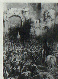
Erstürmung von Solferino