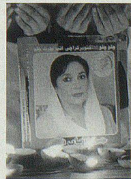
Anschlag auf Benazir Bhutto