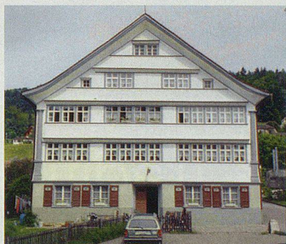
Das Alte Rathaus Trogen am neuen Standort in Bühler.

Dieses Angebot veranlasste die Familie Zellweger in Trogen, den Palast von Landammann