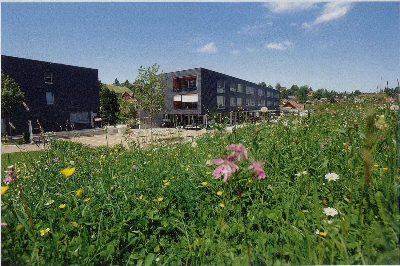
Hof Speicher – ein Lebenskonzept für ein modernes Speicher.