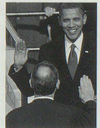
Barack Obama wird US-Präsident