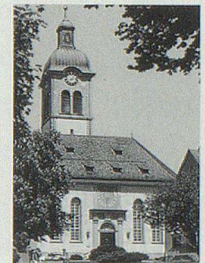
Speicher: Dorf mit mässigem Agglome- rationscharakter