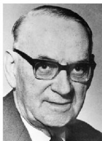
Appenzeller Humanist: Carl Lutz