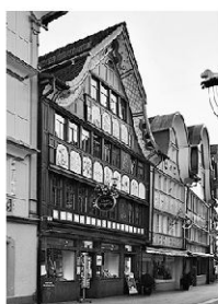
Appenzell: Lebendiger Flecken