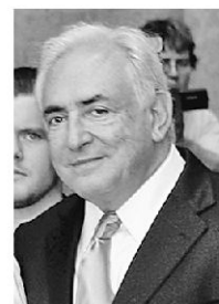
Affäre um IWF- Direktor Dominique Strauss-Kahn