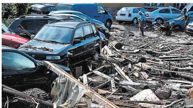
Das Unwetter hatte diverse Gewerbebetriebe an der Alpstein- und der Industriestrasse in Herisau in Mitleidenenschaft gezogen, wie hier eine Autogarage.