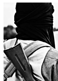
Der Bürgerkrieg in Syrien ging auch 2013 heftig weiter.