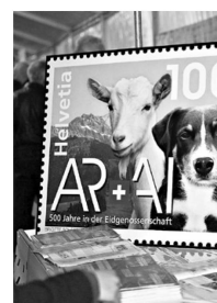
Die Sonder- briefmarke zum Jubiläum.