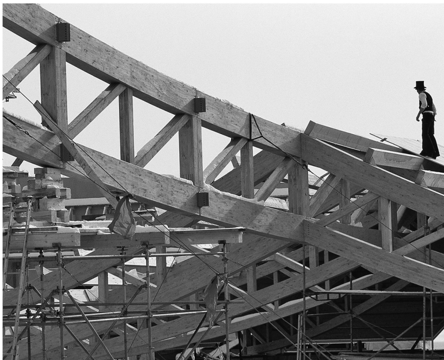
Die BSB-Verbindung kam erstmals beim Bau des Säntisparks in Abtwil zum Tragen.