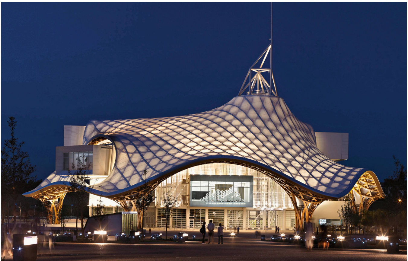
by Shigeru Ban Architects Europe, Paris

«Das Glück des Tüchtigen» lächelte den Planern aus Waldstatt und Herisau auch in der Schweiz: Mit dem Neubau Werd des Zürcher Medienkonzerns Tamedia sollten sie gar ein neues Kapitel in der Holzbau-Geschichte schreiben. Zum ersten Mal wurde ein Gebäude in dieser Grösse ohne Stahlverbinder und ohne Nägel und Schrauben errichtet. Die Steckkonstruktion war eine gestalterische Vorgabe des Architekten – wiederum Shigeru Ban. Hermann Blumer und die Ingenieure und Statik-