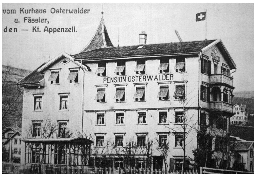
Verschwunden ist auch die ab 1930 von der legendären Naturheilerin Petronella d'Acierno alias «Pagliano-Tante» geführte Pension Osterwalder.

Trotzdem aber blieb und bleibt für Heiden der Tourismus wichtig, und bedeutende Meilensteine auf dem Weg in die diesbezügliche Zukunft waren in der jüngeren Vergangenheit der Neubau des Kursaals und des Hotels Heiden sowie die in mehreren Etappen erfolgte Modernisierung des Heilbades Unterrechstein. Überdies sind derzeit Erneuerungen im Bereich der Hotels «Park» und «Nord» geplant. Bereits im Entstehen begriffen ist das neue, verschiedene Lokalitäten und eine Tiefgarage aufweisende Panoramarestaurant «Fernsicht» an der Seallee, dessen Eröffnung im Jahre 2015 erfolgt.