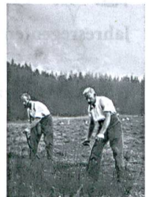
Die Kunst des Handmähens, S. 66