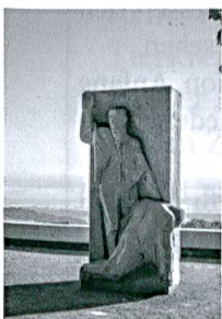
Dorfrundgang in Heiden, S. 82