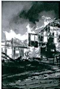
175 Jahre Assekuranz AR, S. 53