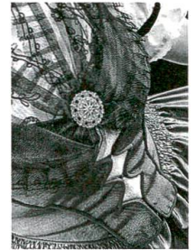
Trachten: Ausserrhoder Kulturgut, S. 62