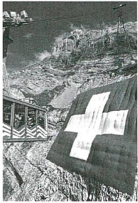
Grösste Schweizerfahne, S. 54