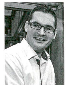
David Zuberbühler, Nationalrat, S. 120