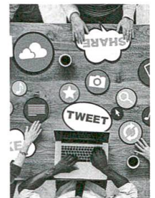
So funktionieren Facebook, Twitter und Co., S. 73