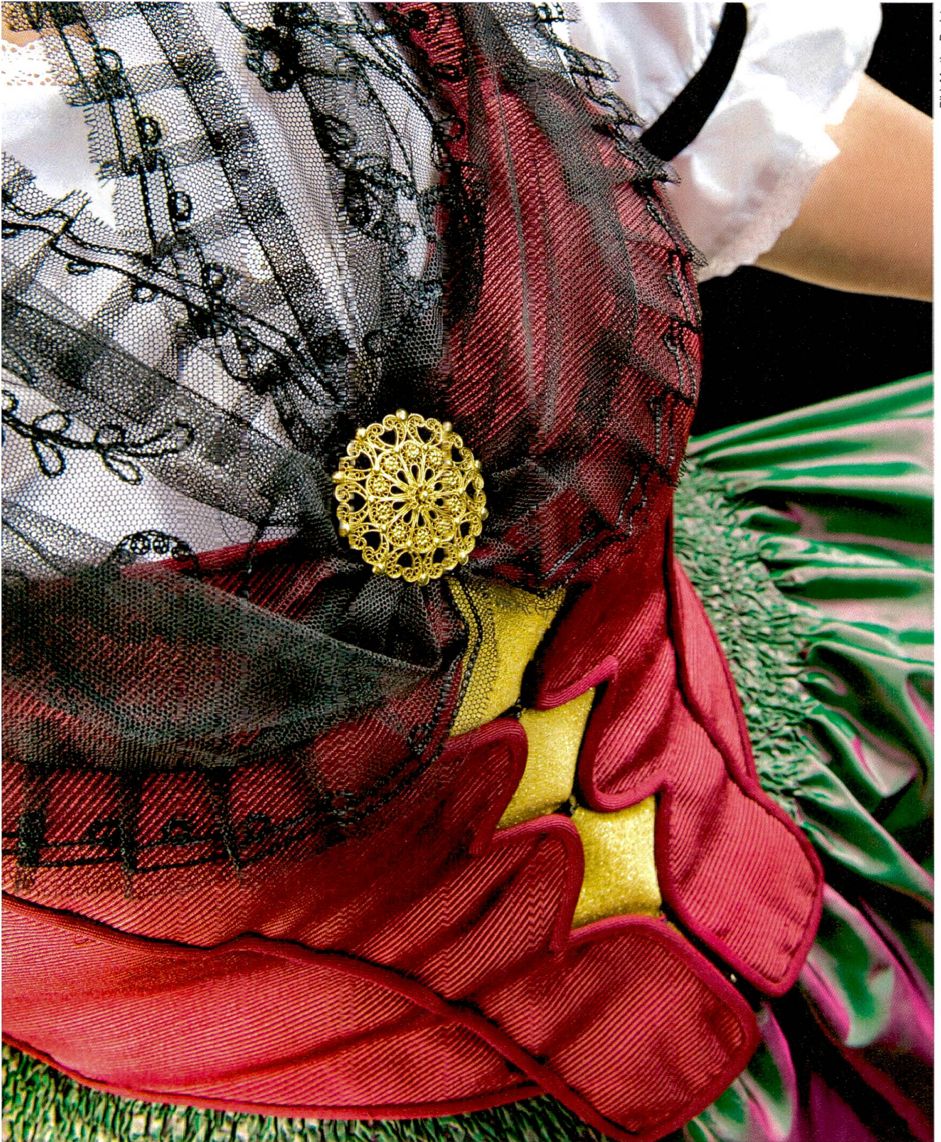
Eine Ausserrhoder Frauen-Sonntagstracht.