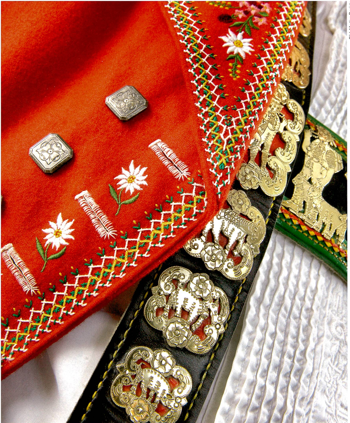
Eine Ausserrhoder Männertracht.