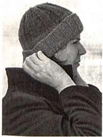
Für einen warmen Kopf, S. 61