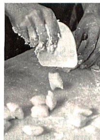
Drei-Gang-Menü zum Nachkochen, S. 73