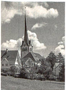
Dorfrundgang in Teufen, S. 84