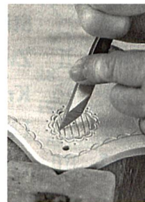
Altüberliefertes Handwerk, S. 62