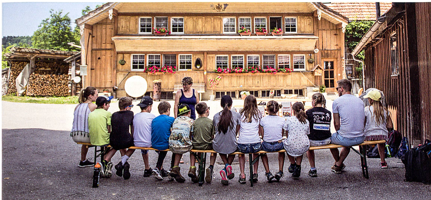
Bilder: Carmen Wueest