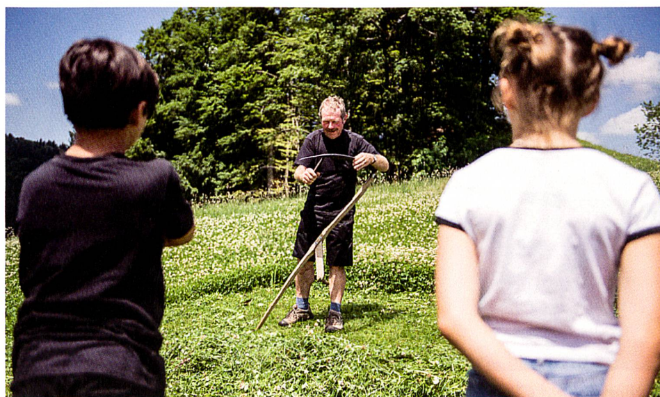
Auf dem Erlebnisbauernhof gibt es viel zu entdecken.