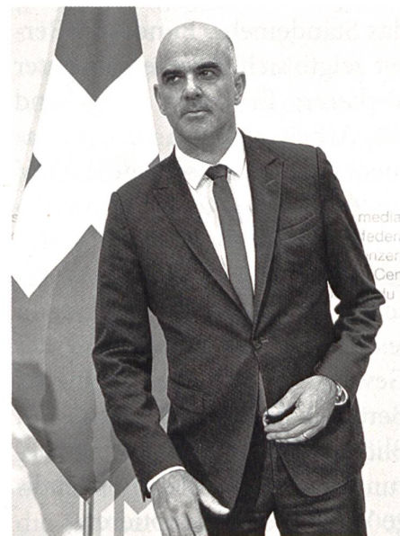
Innenminister Alain Berset zeigt sich nach der Verwerfung der AHV-Reform als guter Verlierer.

ren es bereits 30, und in weiteren 30 Jahren werden 100 Erwerbstätige aller Voraussicht nach für 45 bis 50 rentenberechtigte Personen aufzukommen haben. Diese demographischen Perspektiven sind seit längerem bekannt. Doch Bunderat und Parlament taten sich schwer, eine mehrheitsfähige Reform zu beschliessen. 2004 scheiterte das Projekt einer 11. AHV-Revision in der Volksabstimmung, das ein einheitliches Frauen- und Rentenalter bei 65 Jahren und eine Anhebung der Mehrwertsteuer vorsah. Ein weiterer Anlauf zerschlug sich 2010 bereits im Parlament. Unter dem Titel «Altersvorsorge 2020» wagte Bundesrat Alain Berset nochmals einen grossen Wurf: Mit seiner Reform hätten AHV und Berufsvorsorge gleichzeitig bis etwa 2030 stabilisiert werden sollen. Bei der AHV waren Einsparungen und Mehreinnahmen