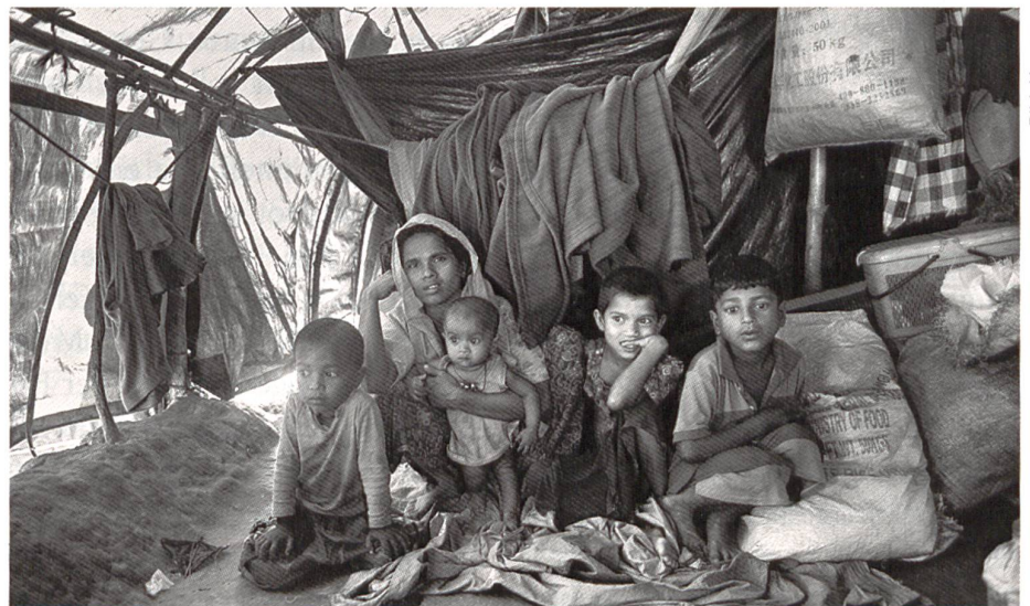
Rohingya-Flüchtlinge aus Burma in einem Lager im Nachbarland Bangladesh.

Indonesien galt stets als Land mit einer überaus sehr toleranten muslimischen Bevölkerungsmehrheit. In den vergangenen