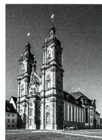
Stadtrundgang in St. Gallen, S. 84