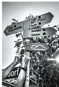
800 Kilometer Wanderwege, S. 53