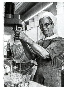
Klosterladen Leiden Christi S. 70