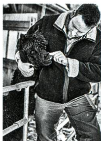
Im Einklang mit der Natur, S. 76