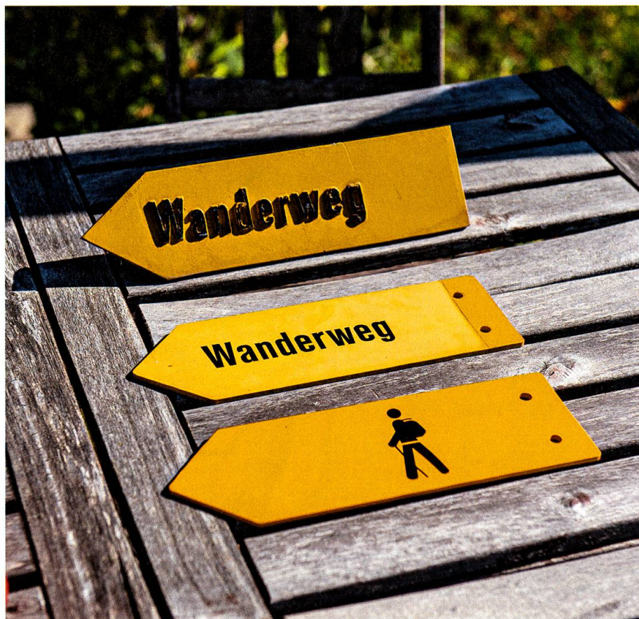
Bis 2022 müssen sämtliche Signalisationen erneuert werden.