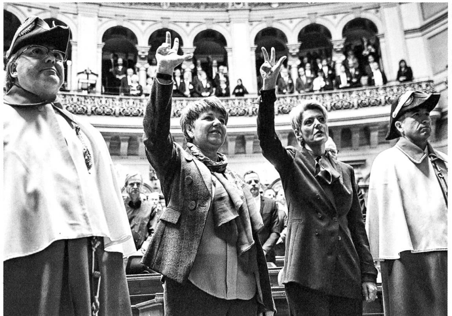
Zwei neue Frauen im Bundesrat: Viola Amherd (links) und Karin Keller-Sutter bei ihrer Vereidigung am 5. Dezember 2018.

Per Ende 2018 gab es zwei Wechsel im Bundesrat: Ihren Rücktritt erklärten Johann Schneider-Ammann und Doris Leuthard. Leuthard hatte die schweizerische Verkehrs- und Energiepolitik seit 2010 geprägt und in dieser Funktion praktisch alle Volksabstimmungen gewonnen; Schneider-Ammann setzte sich erfolgreich für einen besseren Marktzugang von Schweizer Firmen ausserhalb Europas ein. Am 5. Dezember 2018 wählte die Bundesversammlung die Walli-