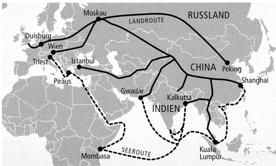
Chinas Initiative zur Neuen Seidenstrasse.

Der Geldsegen aus China verleitet indessen nicht wenige Staaten dazu, sich übermässig zu verschulden. Besonders gefährdet sind arme Länder in Süd- und Südostasiens, Afrikas und Zentralasiens. In dieser Schuldenfalle sitzen bereits Staaten wie Sri Lanka, Myanmar und Kambodscha. Sri Lanka, das seinen Schuldenzahlungen nicht mehr nachkommen konnte, musste den Hafen und ein In-