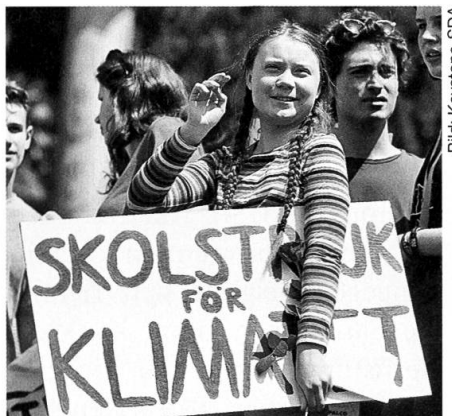
Ikone der weltweiten Klimaschutzbewegung: die 16jährige schwedische Aktivistin Greta Thunberg.

In Frankreich sah sich der 2017 glanzvoll gewählte Präsident Emmanuel Macron mit einer Protestbewegung konfrontiert,