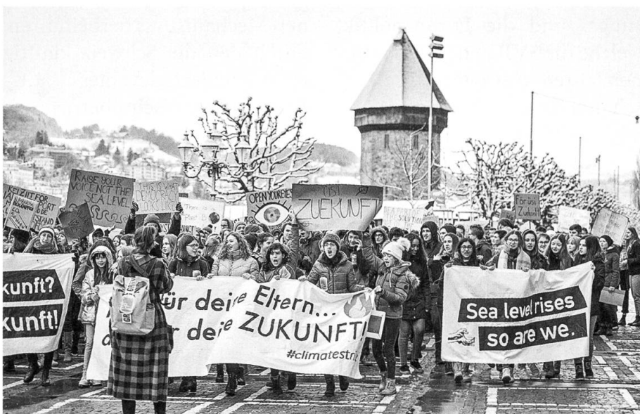
Auch in der Schweiz (Bild aus Luzern) gehen zahlreiche Schülerinnen und Schüler zugunsten des Klimaschutzes auf die Strasse.

Hintergrund dieses Umdenkens war die Feststellung, dass die Klima- und Umweltfrage zu Beginn des Wahljahrs 2019 in der Bevölkerung plötzlich wieder ins Zentrum zu rücken begann. Seit Februar gingen auch in der Schweiz Tausende von Schülern auf die Strassen, um für griffige Massnahmen zum Klimaschutz zu demonstrieren. Die Bewegung fand in weiten Teilen der Bevölkerung Unterstützung. Bei den Passagierzahlen am Flughafen Zürich schlug sich die neue Anti-Flug-Stimmung in-