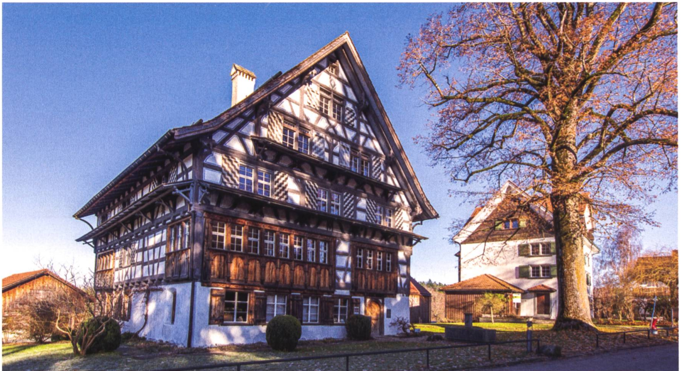
Das Alte Rathaus im Weiler Schwänberg.

Dass im Schwänberg gut betuchte Familien lebten, sieht man noch heute. Sie liessen sich vor allem in der ersten Hälfte des 17. Jahrhunderts dort nieder. Sehenswert ist nicht nur das Alte Rathaus, sondern auch das urtümliche Rutenkaminhaus, die – seit Längerem geschlossene – Wirtschaft Sternen mit ihrem mehr als 300 Jahre alten Brotbackofen und das weisse Haus mit dem Tuffsteinkeller.